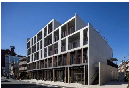
CONTRAL nakameguro 外観