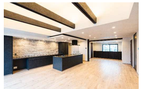
レジデンス専有部