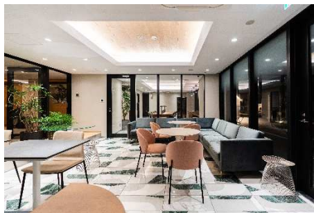
COZY LOUNGE / コージーラウンジ