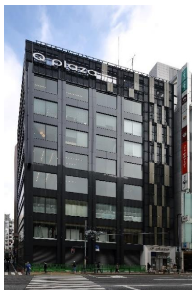
リニューアル後（昼景）