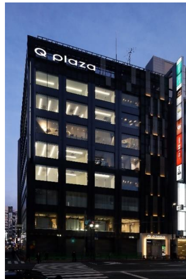
リニューアル後（夜景）