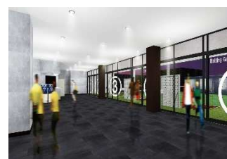
池袋バッティングセンター