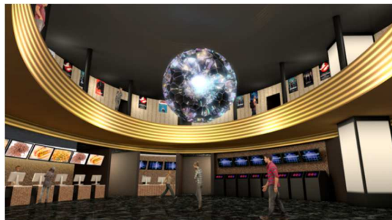
▲4F 「Light Sculpture(仮)」

美しい天上画アートモーショングラフィックス (H10×W31m型 LED ビジョン)