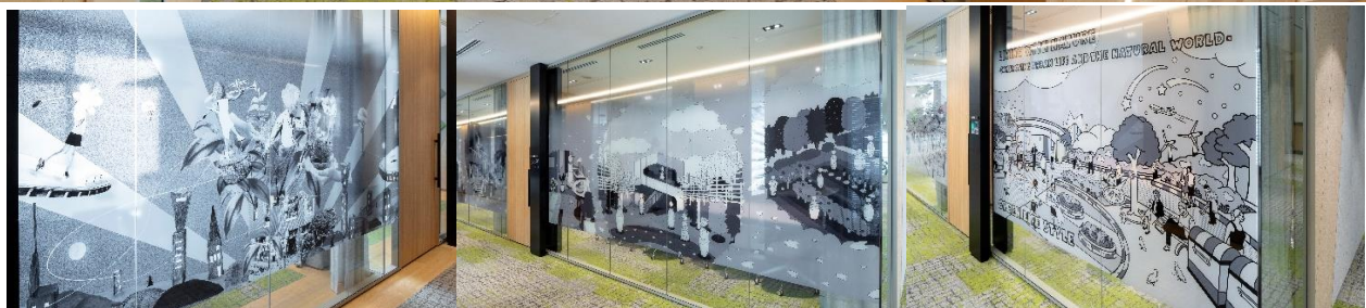
(アートを配した通路。渋谷区内の当社施設での環境に関する取組をモチーフとしたアートを作成)