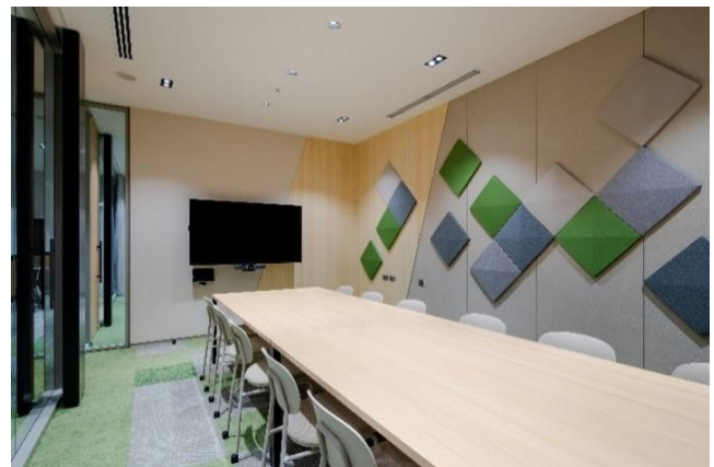
（岡山県西粟倉村の間伐材を活用した机・壁紙など循環型社会および生物多様性の取り組みを体現した会議室）