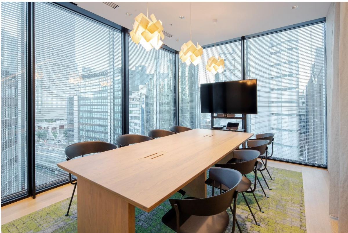
(上・リニューアルした5階受付、下・会議室を増設)