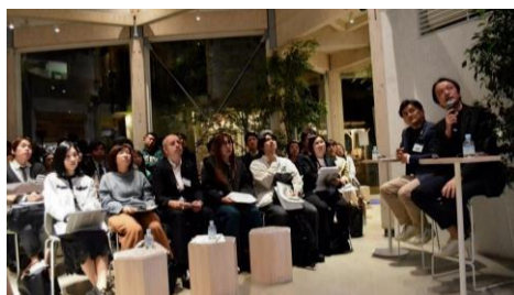
TENOHA 代官山を活用してのトークイベント