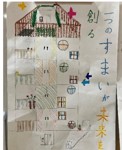
児童が作成した 環境先進マンションの広告