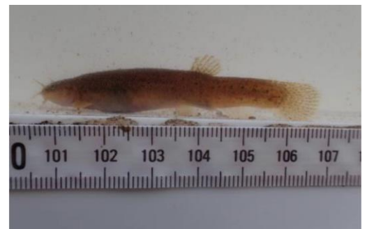
ホトケドジョウの個体写真