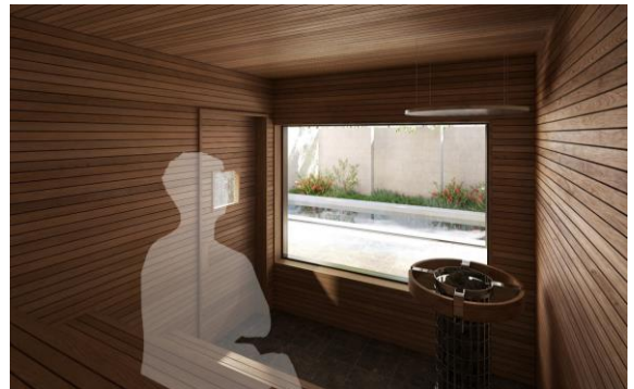
SAUNA YOI 宵-よい- イメージ