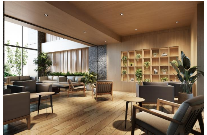
ラウンジイメージ