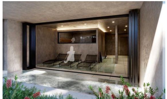
SAUNA AKE 明-あけ- イメージ