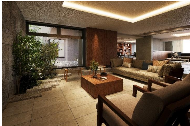
コミュニティサロン

の空間を演出します。加えて、株式会社スポーツオアシス監修のフィットネスルーム、宿泊機能だけでなく、複数名での団欒を楽しむことも可能なゲストルーム兼パーティールーム、屋上テラスを備え、暮らしを彩ります。そのほか、当社が2020年11月に京都市内にて開業したホテル「nol kyoto sanjo」に所縁ある日本酒をお楽しみいただけるイベントの開催やゲストルーム利用者に向けたスパサービス等、質の高いソフトサービスも提供予定です。