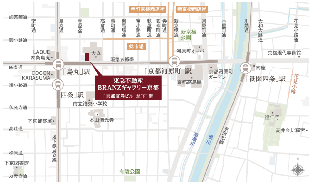
モデルルーム位置図