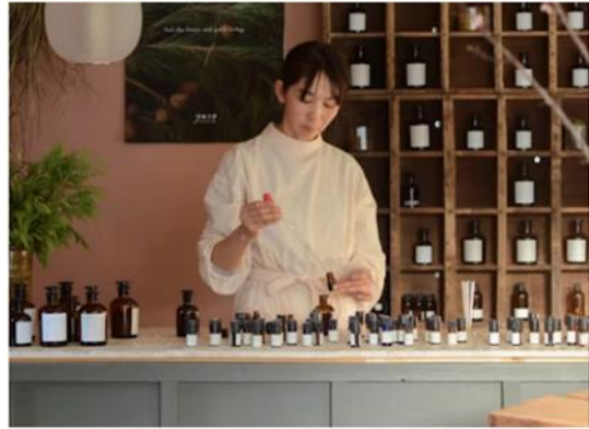
森の恵を使ったワークショップ

本ツアーは、八ヶ岳の風土や環境を活かしながら自分らしくユニークな生活を送る“暮らしのマイスター”の案内のもと、八ヶ岳の恵を使って自分でつくる楽しさを体験できる「CRAFT ワークショップ」や、マイスターと参加者同士での交流タイム、さらにはとっておきの観光スポットを訪ねる時間も盛り込んだ、1泊2日の茅野の魅力と暮らしを知る旅です。