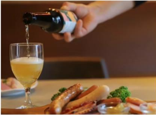
クラフトビールを堪能できる時間もあります