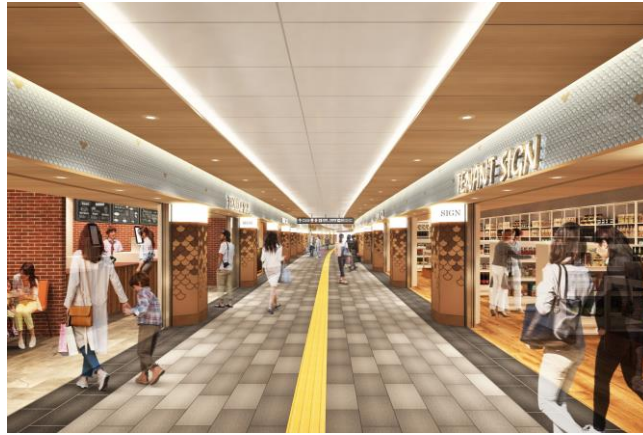
「メイチカ」リニューアル後イメージパース