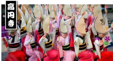
高円寺連協会 合同連