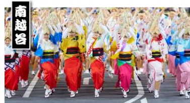
南越谷阿波踊り振興会 合同連

また、各演舞場など渋谷サクラステージ内に設置する 4 つのスタンプスポットをめぐるデジタルスタンプラリーも開催します。スタンプを集めると、渋谷サクラステージテナントのグッズやチケット等、ハズレなしのガラポンにチャレンジいただけます。参加賞のフード&ドリンクチケットは、渋谷サクラステージだけではなく、近隣施設の「東急プラザ渋谷」「渋谷ストリーム」の協力店舗でご利用いただけます。