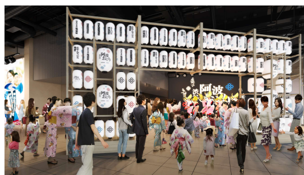
BLOOM GATE での開催イメージ

阿波おどりは、江戸時代から400年以上続く伝統芸能ですが、一説では徳島城の築城を祝う落成式で踊ったことが起源と言われています。このストーリーに着想を得て、渋谷サクラステージのオフィステナントである Sansan と共催し、渋谷サクラステージの本格開業を来街者や入居するテナント企業、近隣住民と祝う「渋谷阿波おどり powered by Sansan」を開催します。