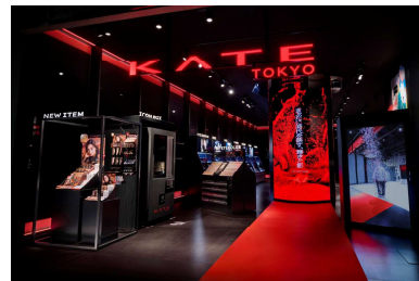
3 階 KATE 店舗

同施設 3 階テナントのグローバルメイクアップブランド「KATE」は、BLOOM GATE において、コラボステージとして参加し、メイクアップライブを開催いたします。