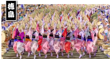
阿波おどり振興協会 選抜連