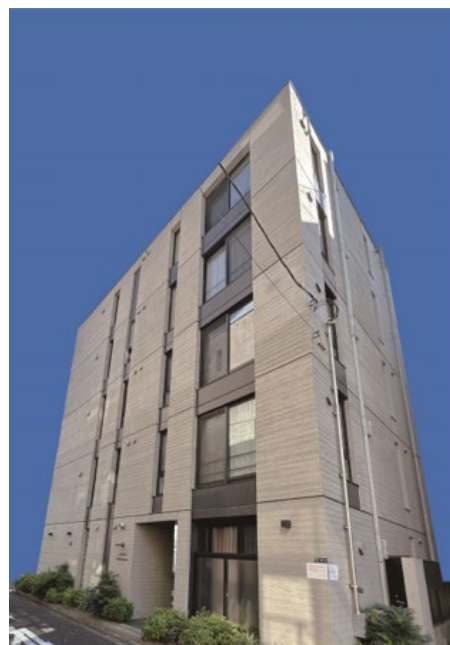
レガシア南麻布 外観写真 (2024年11月撮影)

一棟の賃貸不動産を複数の相続人が相続した場合、保有か売却かで争いになることがあります。しかし不動産小口投資は、それを複数口取得することにより分割しやすくなり、争いを回避するのに効果的です。