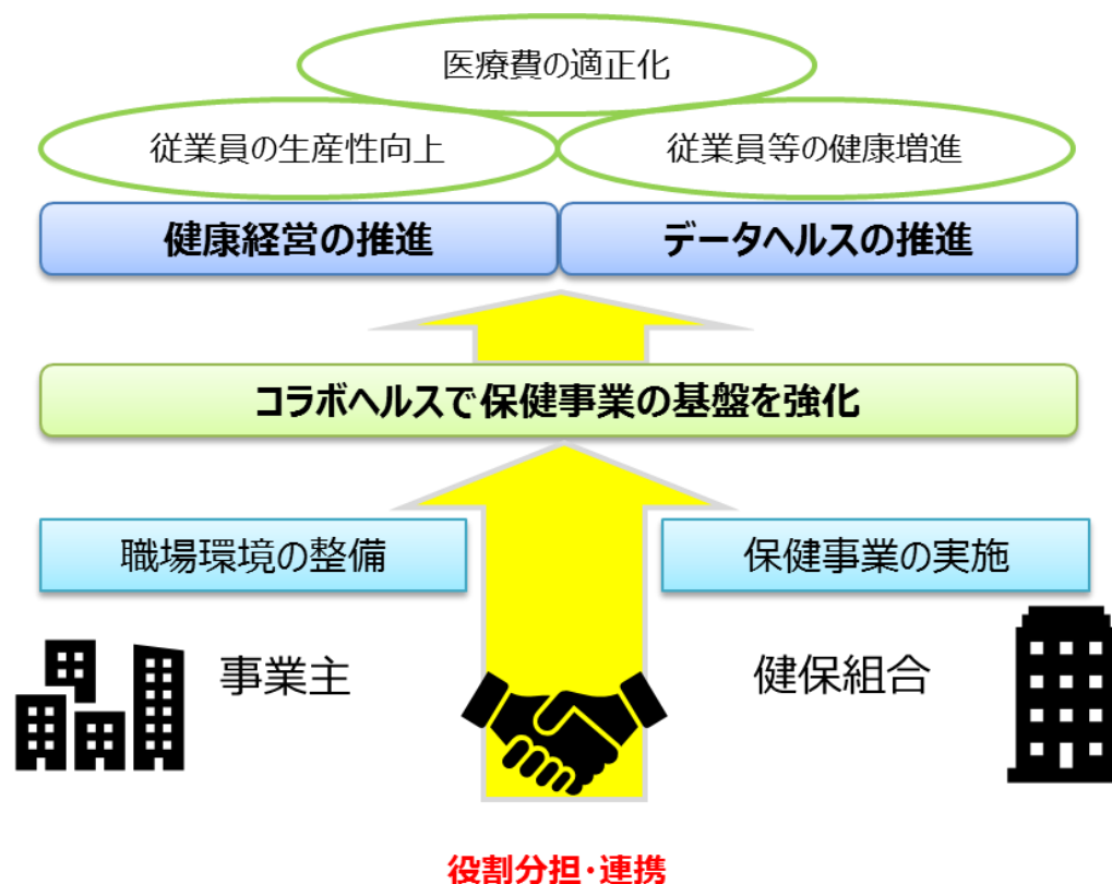
図1：厚生労働省保健局 コラボヘルスガイドラインより作図

また同時に、企業は【健康経営の推進】健康保険組合は【データヘルス計画の推進】が求められており、一人一人異なる健康課題に対して解決策を講じる必要があります。（図1）