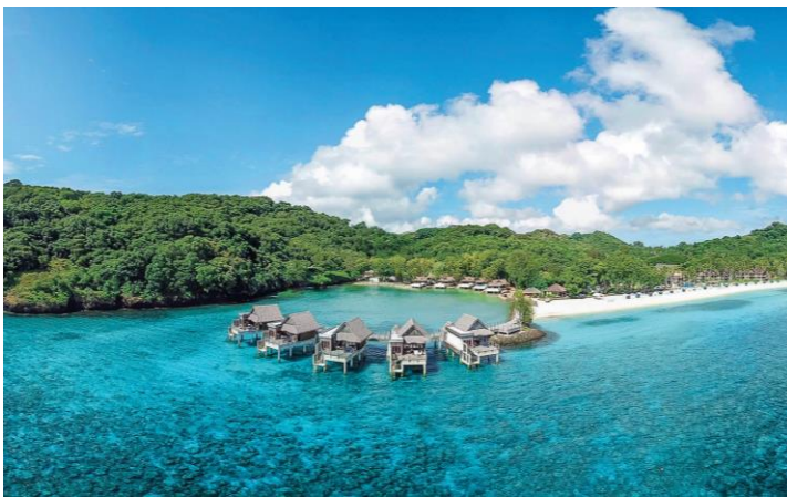
パラオ パシフィック リゾート全景

海洋生物豊富な西太平洋と、パラオの固有種や絶滅危惧種等の鳥類が多く生息する森林に囲まれた、豊かな自然を同時に体験することができる希少性の高いロケーションを生かし、パラオ政府が自然環境の保護と観光業の発展を両立させるために掲げる、ハイエンド向けのエコツーリズム・デスティネーションへの変革という目標に向け、今後も更なる取り組みを強化していきます。