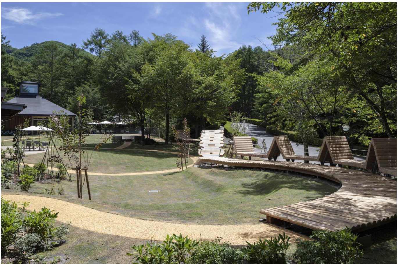
芝生と木に囲まれた緑豊かな空間