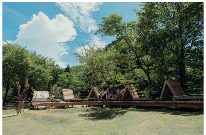
広場を囲むループテラスと造作ベンチ