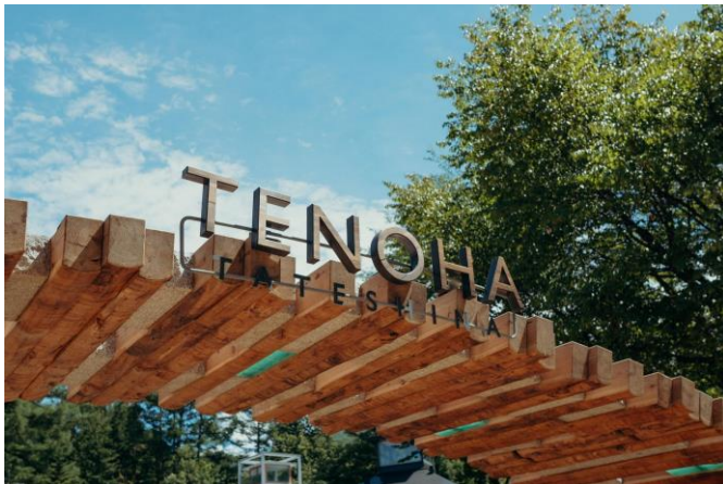
広場の入口ゲート

広場の入口ゲートには、木材だけでなく、地域の石材や、工事の際に出たガラス廃材をアップサイクルして作ったガラスブロックをあしらっています。そのゲートから繋がり広場を囲むループテラスは、タウンから始まる地域循環の輪を表現しています。