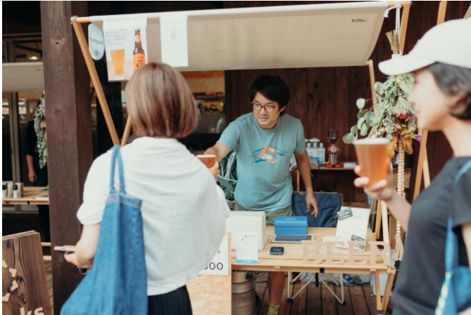
蓼科湖畔に醸造所を構える株式会社エイトピークス

TENOHA 蓼科に隣接する広場において、2024年7月26日から28日までの3日間「まちびらきマルシェ」を開催しました。地元の飲食店や木材を扱う地域事業者のブースが並び、別荘利用者やタウン内宿泊者、近隣市町村の住民の方が多く集まりました。今回のマルシェイベントをきっかけに初めてタウンを訪れたという地元の方の声も多く聞くことができたほか、地域の事業者同士の横のつながりも生まれ、地域コミュニティ創出の拠点としての第一歩を踏み出しました。